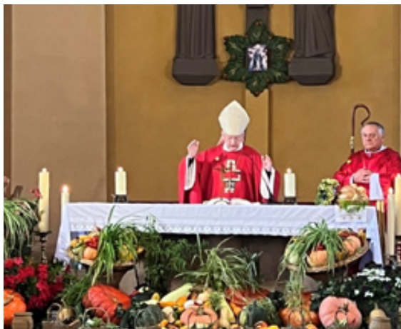
La fête patronale le 15 septembre s'est déroulée dans une église Saint-Matthieu joliment décorée par les Amis des Jardins à l'occasion de l'Action de Grâce pour les fruits de la terre et en présence de Mgr Roland Minnerath, ancien archevêque de Dijon.