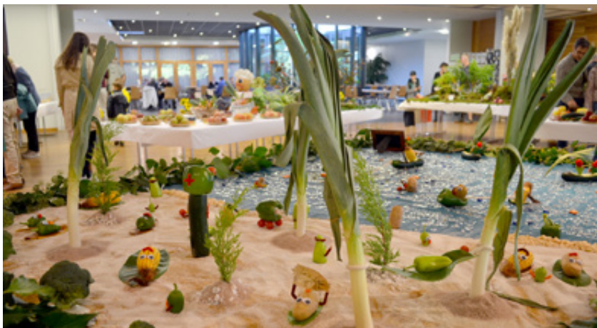
Les 5 et 6 octobre , les Amis des Jardins ont présenté une très belle édition de leur exposition annuelle . Entre tableaux végétaux, stands pédagogiques sur l'environnement, concours de dessins sur le thème du « jardin du futur » et vente de fruits ou de miel, l'Espace « Le Gabion » était passé en mode nature pour le plus grand bonheur des nombreux visiteurs.